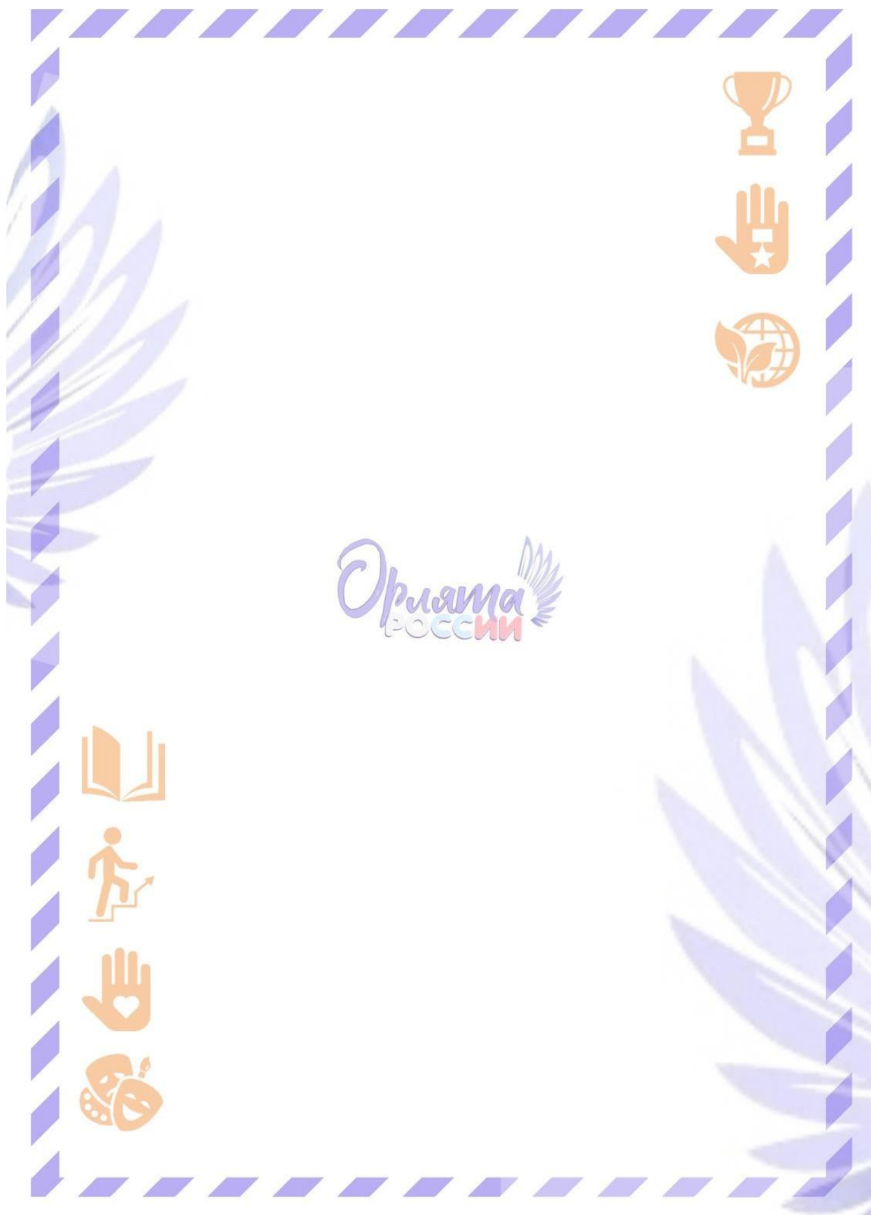
Рис. 2. Обратная сторона «Письма в Будущее»