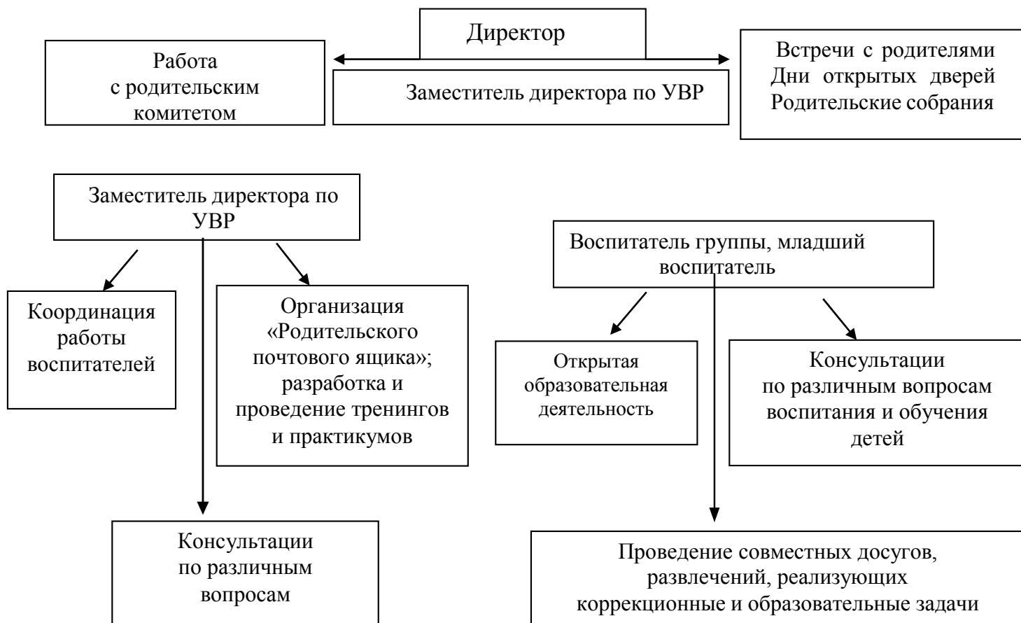
Схема взаимодействия с семьями воспитанников